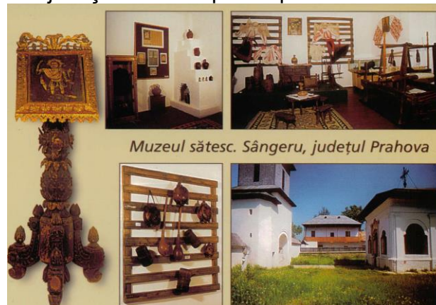
Muzeul sătesc. Sângeru, județul Prahova

abia prin 1925. Între 1939-1943 i s-au făcut consolidări, când a fost și repictată, în frescă, de Veniamin Precup. Conacul a fost construit înainte, dar a continuat finisarea paralel cu construcția bisericii și apare semnalat în „diata” lui Bozianu din 1802, ca edificiu mănăstiresc. Conacul are aspectul unei case țărănești, de proporții mari, cu un corp central, cu parter și etaj, fiecare prevăzute cu prispă. În epocă, se pare că a avut și un foișor, care a dispărut odată cu modificările survenite în sec. XX. Prisma de la parterul corpului central se crede că se continua la nivelul fațadei clădirii anexă, care a fost folosită pentru găzduirea monahilor (chilii pentru călugări), mai apoi ca încăperi ale personalului de serviciu. Nu se știe cât a funcționat la lăcaș mănăstiresc, dar e sigur că la trecerea dincolo de „zare” a ctitorului, devenit între timp stolnic și sătrar, acesta a lăsat moșia ca danie mănăstirii de aici. În sec. XIX-lea acoperișul de șindrilă a fost înlocuit cu tablă. În prezent, prin strădania autorităților locale, în conacul Bozianu funcționează un muzeu sătesc unicat în județul Prahova prin exponatele sale.